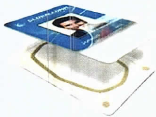
High Definition Printing