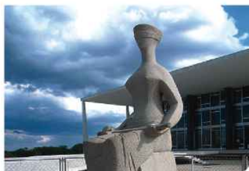
"A Justiça" Alfredo Ceschiatti, Brasília, Brasil

Profissão liberal, de independência absoluta, múnus de interesse público, órgão de administração da justiça, com função social de representação, garante do exercício da cidadania e da construção da solidariedade activa, defensor da dignidade da pessoa, da vida e da actividade humana e baluarte da protecção dos direitos humanos fundamentais.