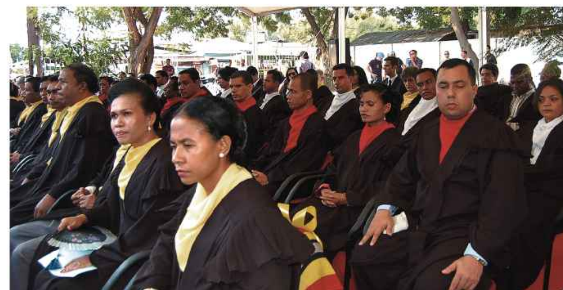
Tomada de posse do primeiro curso de Magistrados e Defensores Públicos