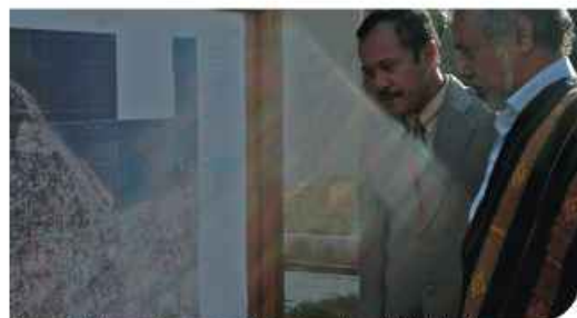
Cerimónia de lançamento do projecto de levantamento cadastral sistemático

Foti dadus propriedades nian atu halo desenvolvimentu konaba baze dadus ba kadastrus sei hahu iha fulan Setembru tinan 2008.