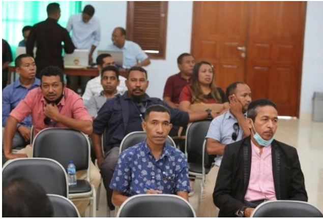
Foto sira iha kraik: Partisipante sira ne'e bé partisipa iha PECAC 2021-2025, durante lora haat (4) nia lora iha Sentru Formasaun João Paulo II Comoro Dili Timor-Leste. Partisipante sira ne'e, mai husi CAC no representante husi entidade oi-oin.